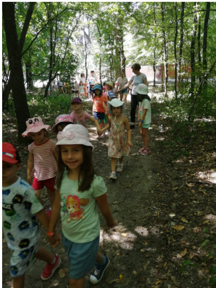
Traseu aplicativ - pădure