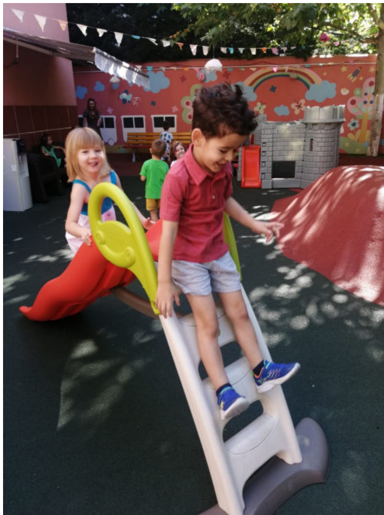
Joc și joacă în curtea grădiniței