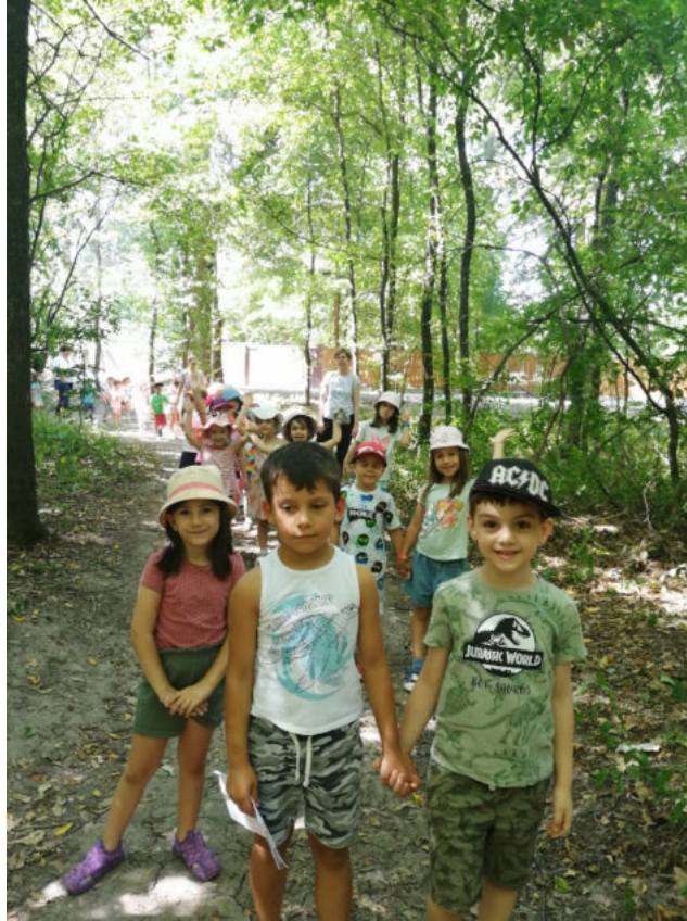
Traseu aplicativ - pădure